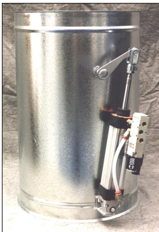
Versione a disco

Pneumatiche: Comandate con cilindro ad aria compressa.